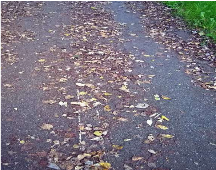
Deficitaria señalización de puntos peligrosos